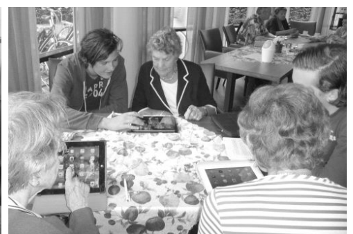
iPad-cursussen, gegeven door leerlingen van het Willem de Zwijger college